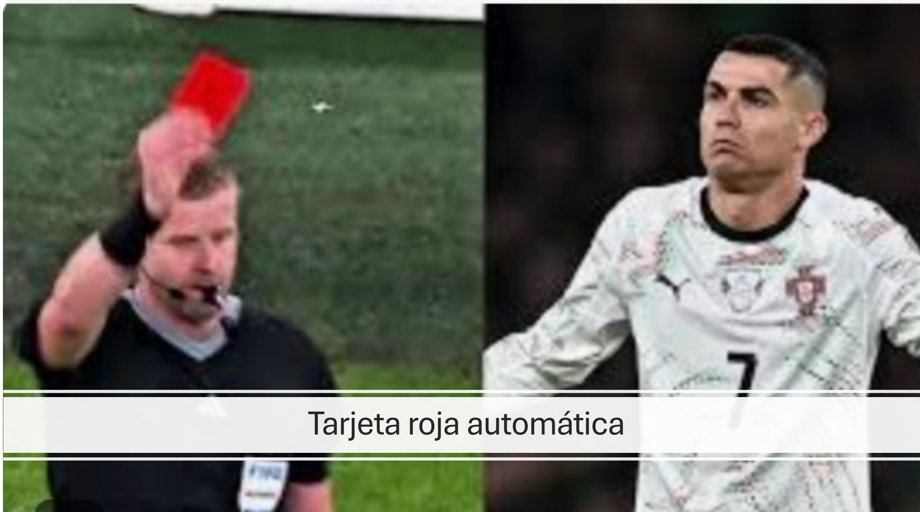
Tarjeta roja automática